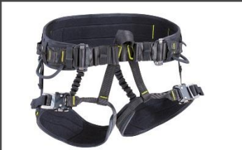
CORE CL Farbe: night-oasis Artikelnummer: 88049 - XXX - 219 0