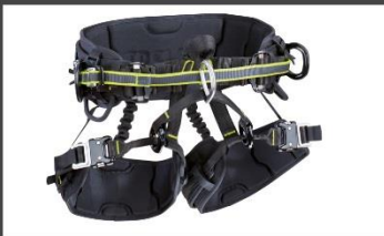
TREE CORE Farbe: night-oasis Artikelnummer: 88050 - XXX - 219 0