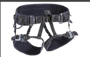
CORE CL Farbe: night Artikelnummer: 88049 - XXX - 017 0