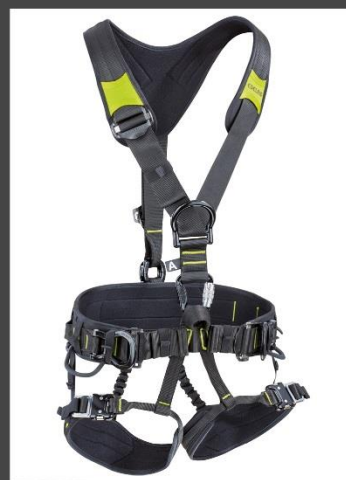
CORE PLUS CL Farbe: night-oasis Artikelnummer: 88058 - XXX - 219 0